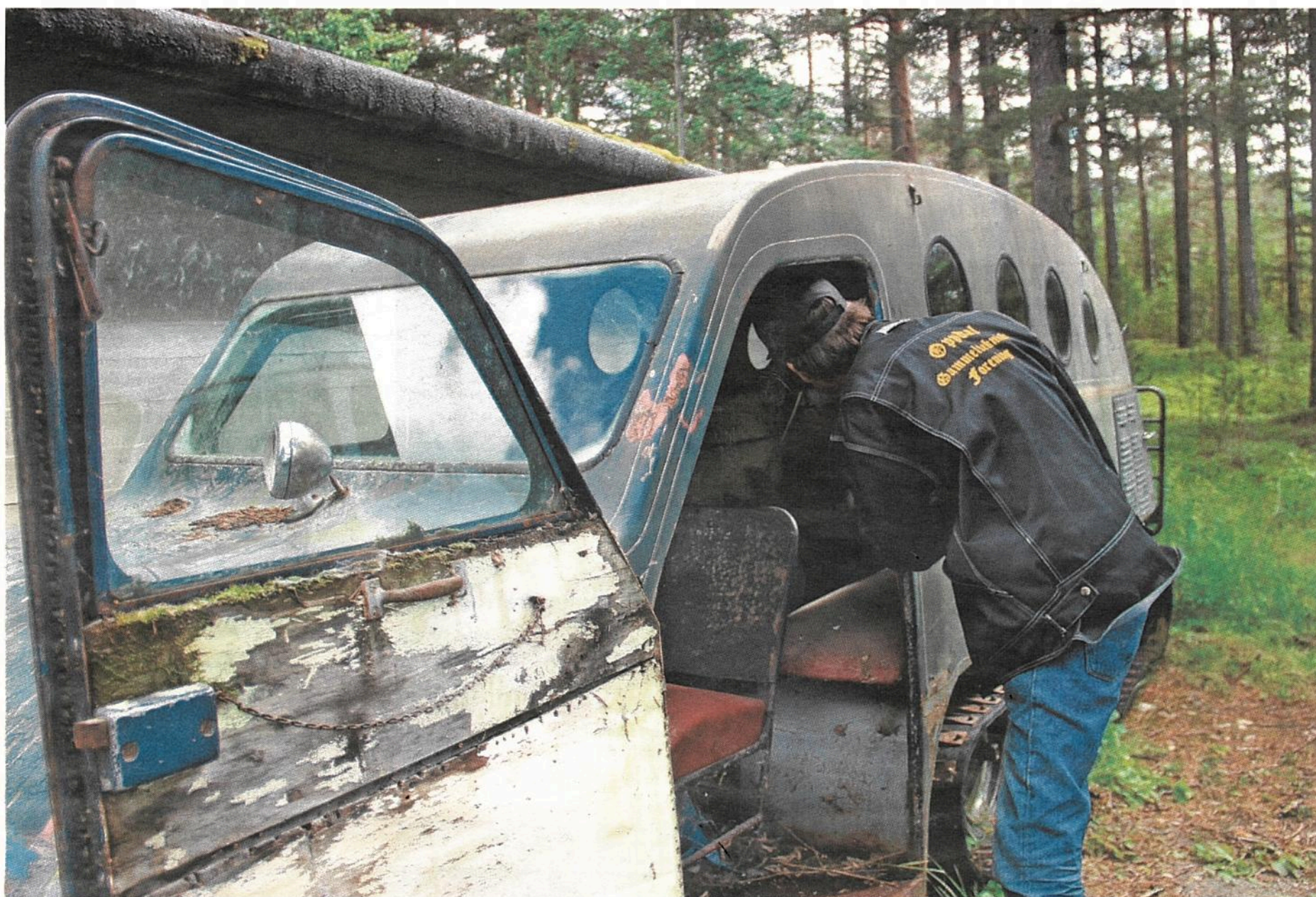
MOSEGRRODD: Bombardieren bærer preg av å ha stått lenge ubrukt. Nå får Oppdal Gammeltekniske forening en stor jobb i å restaurere bilen, der det er grodd mose i døra.